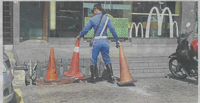
An MBPJ enforcement officer removing traffic cones obstructing parking bays in SS2.