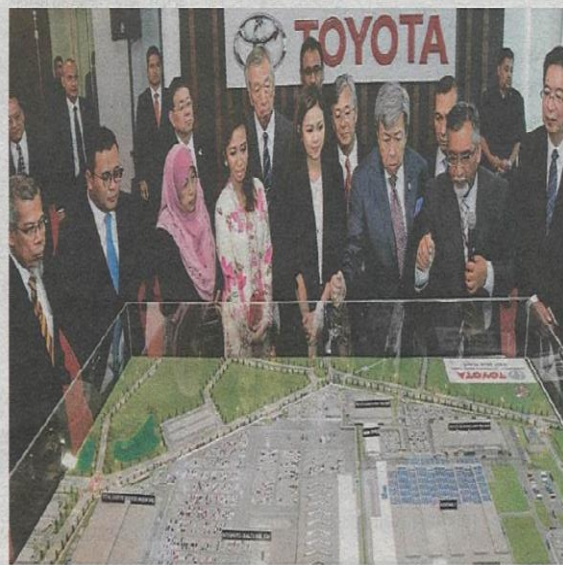
Sultan Sharafuddin (tiga dari kanan) dan Tengku Permaisuri Norashikin (empat dari kanan) melihat replika kilang ASSB di kawasan perindustrian Bukit Raja semalam.

Beliau berkata demikian ketika berucap pada Majlis Meraikan 50 Tahun