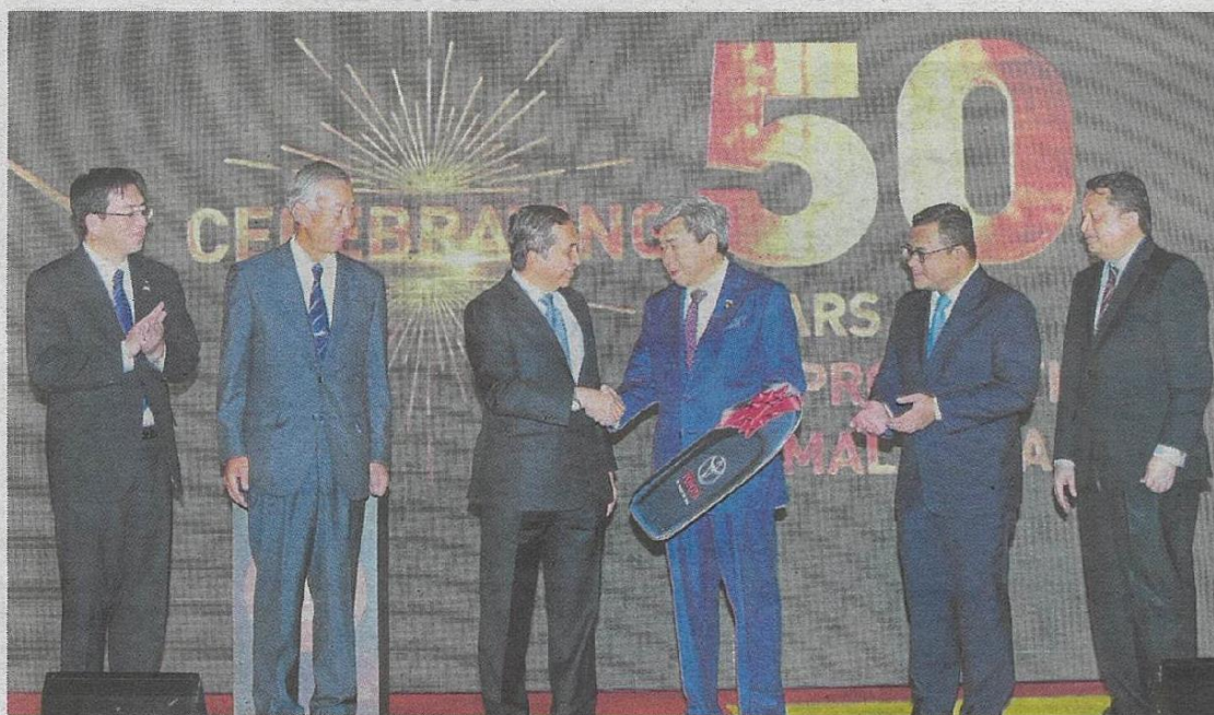
SULTAN Sharafuddin berkenan meraikan Sambutan 50 Tahun Pengeluaran Toyota di Malaysia.