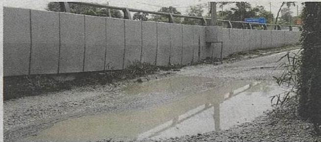
SEBELUM... Keadaan jalan rosak dan berlubang menyebabkan air bertakung jika hujan sekali gus membahayakan nyawa pengguna.

“Dah banyak kali jalan di sini diturap dan dibaiki,